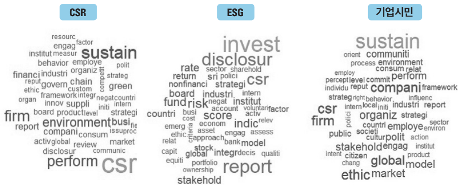
그림 1. CSR, ESG, 기업시민 연구 주제별 빈출 단어

연구 주제별 문헌들 간 공통 단어와 차이를 보다 자세히 살펴보기 위해 상위 20개 빈출 단어를 기준으로 만든 벤 다이어그램 (Venn Diagram)은 아래 [그림 2]와 같다. CSR이 워낙 광범위하게 사용되고 있는 단어이다 보니 세 연구 주제의 공통 단어임을 확인할 수 있고, 산업 (Industries)과 리포트 (Report) 역시 공통 단어로 포함되는 것을 확인했다. 중복된 영역이 없는 각 연구 주제별 별도의 영역들을 보면, 각 주제별 고유의 키워드들과 그 차이를 볼 수 있다. 예를 들어 기업시민 문헌들은 윤리 (Ethics), 정치/영향력 (Politics), 직원 (Employee) 등이 눈에 띄고 CSR은 비즈니스 (Business), 공급 사슬 (Supply Chain), 소비자 (Consumer), 그리고 ESG는 투자 (Investment), 리스크 (Risk), 펀드 (Fund), 그리고 사회적책임투자 (Social Responsible Investment: SRI) 등이 고유한 주요 키워드임을 확인할 수 있었다.