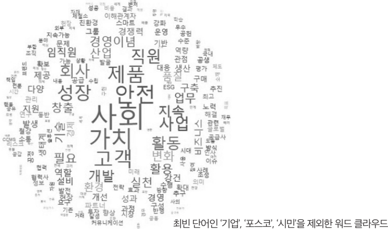
그림 3. 포스코 CCMS (Corporate Citizenship Management Standards) 단어 빈도수 분석결과

CSR, ESG, 기업시민 연구 주제별 텍스트마이닝 작업에 추가하여 본 연구팀은 기업시민을 경영이념으로 삼고 있는 포스코 임직원의 기업시민 실천 가이드인 CCMS (Corporate Citizenship Management Standards)가 어떤 키워드들로 구성이 되어 있는지를 단어 빈도 분석을 통해 살펴보았다. 그 결과는 아래 [그림 3]과 같다. CCMS에서 가장 빈번하게 등장하는 키워드들은 ‘사회’, ‘가치’, ‘안전’, ‘고객’, ‘제품’, ‘성장’, ‘활동’, ‘사업’, ‘직원’ 등 이었다 (최빈출 단어인 ‘기업’, ‘포스코’, ‘시민’은 CCMS내 에서 고유명사처럼 사용되고 있음을 고려하여 제외함). 이 밖에도 ‘지속’, ‘실천’, ‘변화’, ‘경영이념’, ‘품질’, ‘환경’, ‘생태계’, ‘강건’, ‘ESG’ 등도 주요 빈출 단어에 속해 있다.